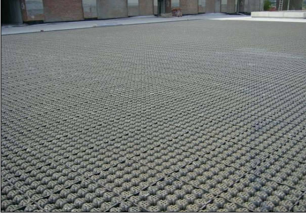
Şek.1 Yerinde kurulumu yapılmış modüller