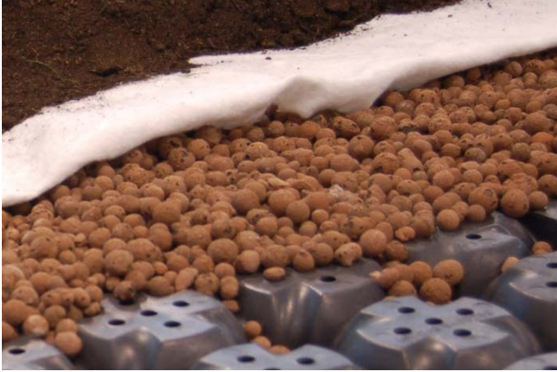
Şek.3 Dolgu, geotekstil ve ayırma tabakası detayı

Bu özel yeşil teras normal bir bahçe ile aynı şekilde kullanılmak üzere inşa edilmiştir. Mükemmel bir dinlenme alanı oluşturmak üzere çim sahanının içinde orta büyüklükte ağaçlar, çalılar ve çiçek yatakları ekilmiştir.