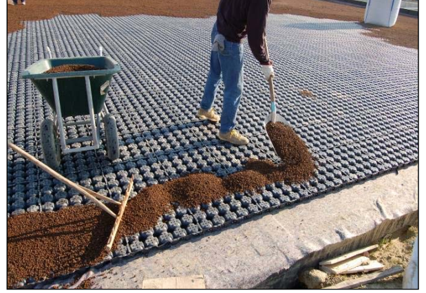
Şek.2 Volkanik taş dolgu

Bu özel yeşil teras normal bir bahçe ile aynı şekilde kullanılmak üzere inşa edilmiştir. Mükemmel bir dinlenme alanı oluşturmak üzere çim sahanının içinde orta büyüklükte ağaçlar, çalılar ve çiçek yatakları ekilmiştir.