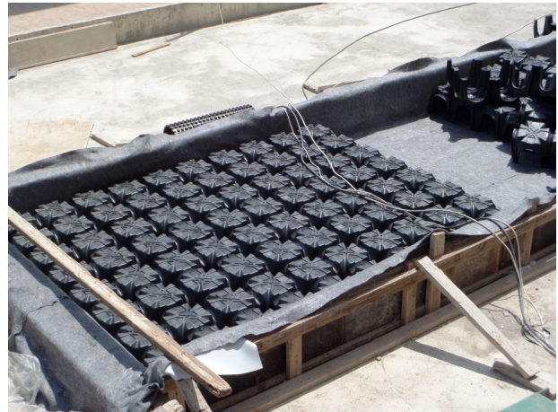
Beton dökümü öncesinde oluşturulan kalıp sistemi