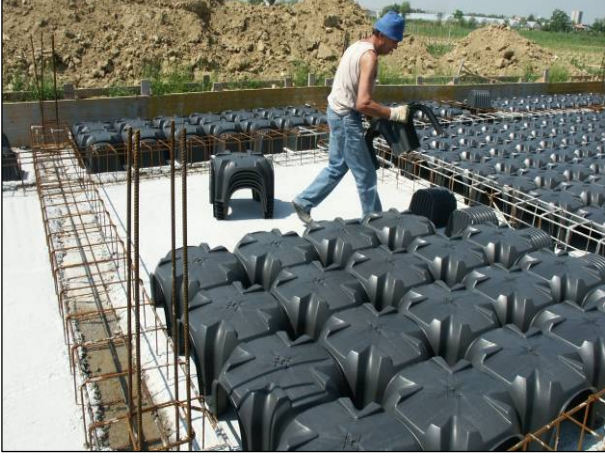
Şek.1 Modulo'nun montajı