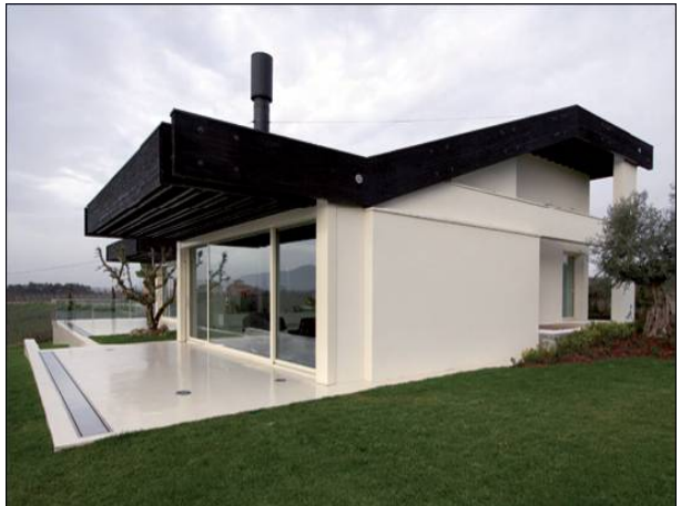
Şek.4 Bitmiş villa