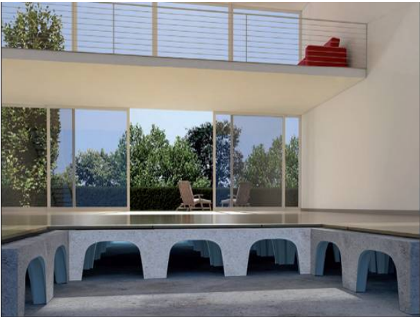
Şek.3 Temel enine kesiti

Bu projede, bina içindeki nemlenmeyi ve Radon gazı birikimini önleyen bir havalandırmalı temel sisteminin oluşturulması amacıyla Modulo H30 kullanılması uygun görülmüştür.