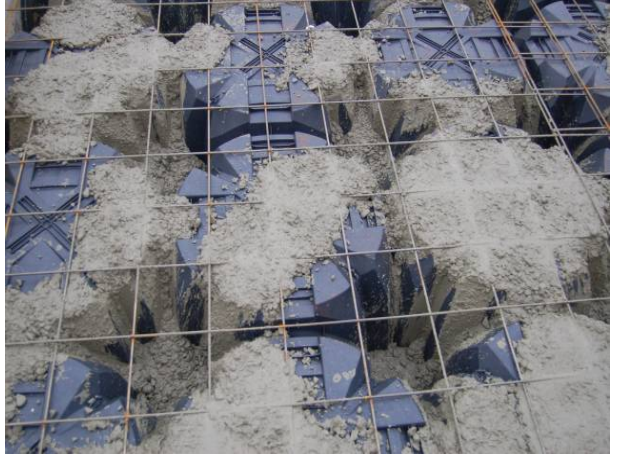
Şek.4 İlk beton döküm aşaması