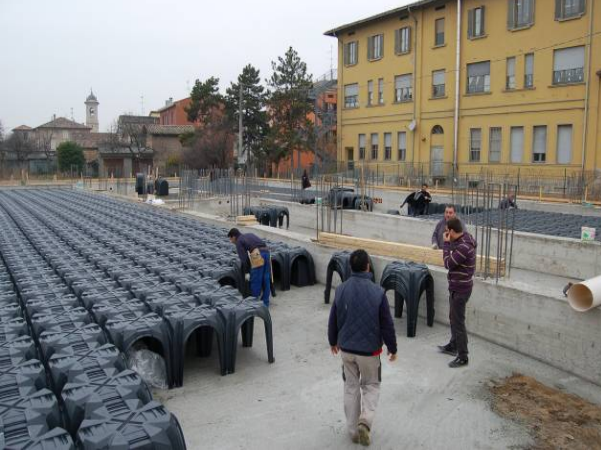
Şek.1 Modulo'nun montajı