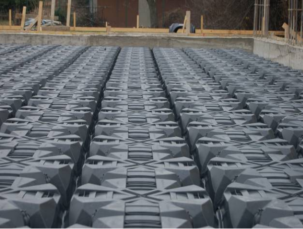
Şek.3 Monte edilmiş Modulo

Bu anaokulu projesinde, su basman döşemesi altı boşluğunda oluşturulan doğal havalandırmanın en iyi şekilde kullanılması amaçlanmıştır. Zemin nemi ve Radon gazının ortadan kaldırılması için Modulo H70 kullanımı uygun görülmüştür. Böylelikle binada sağlıklı bir eğitim ve oyun ortamı oluşturulmuştur.