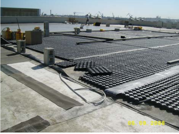
Şek.1 Mevcut plak üzerine Minimodulo montajı