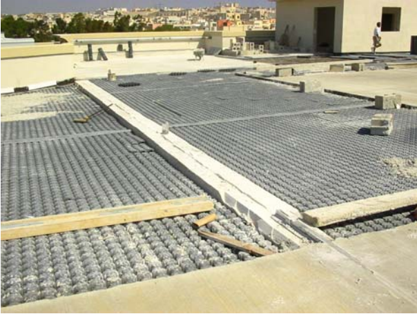
Şek.3 Takviye kirişinin dökümü

Mevcut plak üzerinde bir ısı yalıtımı oluşturmak için Minimodulo H6 kullanılmıştır; boşluk ayrıca elektrik kablosu borularının geçişi için de kullanılmıştır. Minimodulo, üzerine dökülen betonarme plağı çok sayıda noktadan etkin bir şekilde destekler; otopark yüklerinin yapı tarafından güvenli bir biçimde taşınmasını mümkün kılar.