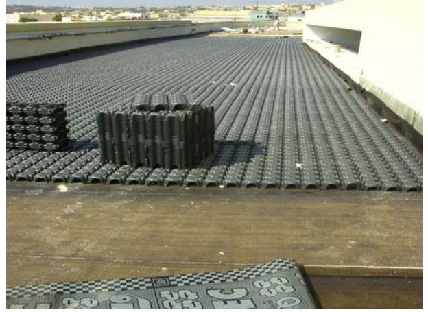
Şek.2 Giriş rampası detayı

Mevcut plak üzerinde bir ısı yalıtımı oluşturmak için Minimodulo H6 kullanılmıştır; boşluk ayrıca elektrik kablosu borularının geçişi için de kullanılmıştır. Minimodulo, üzerine dökülen betonarme plağı çok sayıda noktadan etkin bir şekilde destekler; otopark yüklerinin yapı tarafından güvenli bir biçimde taşınmasını mümkün kılar.