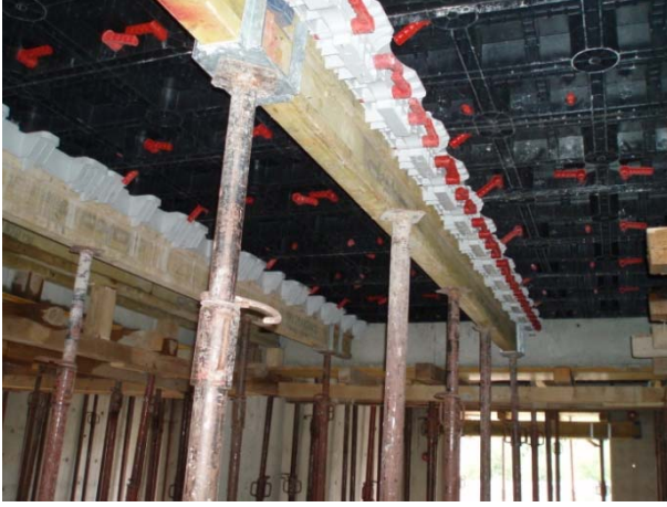
Şek.2 Kurulumu tamamlanmış Geosky sistemi