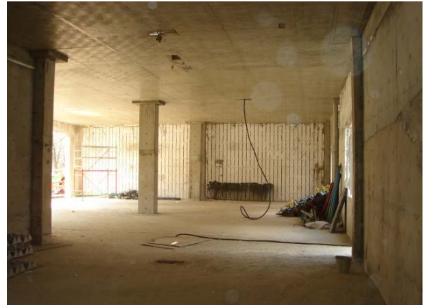
Şek.5 Uygulama sahasının genel görünüşü