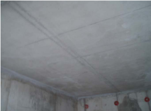
Şek.4 Kalıp sökümü sonrası beton yüzeyi

Plak yüzeyi, Geosky kalıp sisteminin gelişmiş sökme özelliklerinden yararlanılarak üç döküme ayrılmıştır: böylece kullanılan kalıp malzemesi miktarının optimize edilmesi ve şantiye lojistiğinin kolaylaştırılması sağlanmıştır.