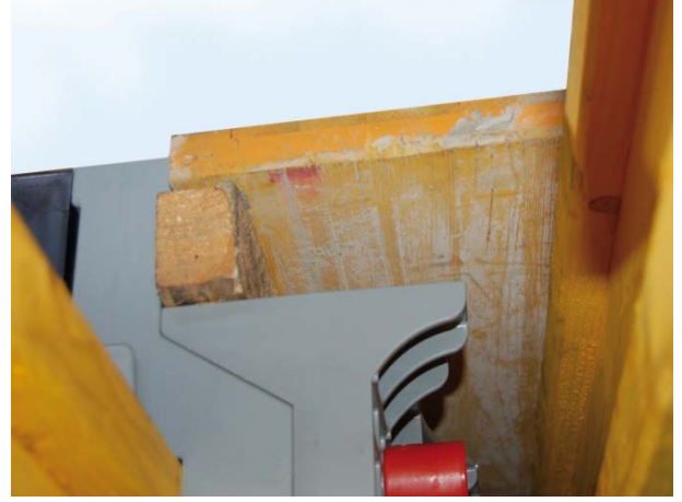
Şek.3 Aşap kompanzasyon detayı

Plak yüzeyi, Geosky kalıp sisteminin gelişmiş sökme özelliklerinden yararlanılarak üç döküme ayrılmıştır: böylece kullanılan kalıp malzemesi miktarının optimize edilmesi ve şantiye lojistiğinin kolaylaştırılması sağlanmıştır.