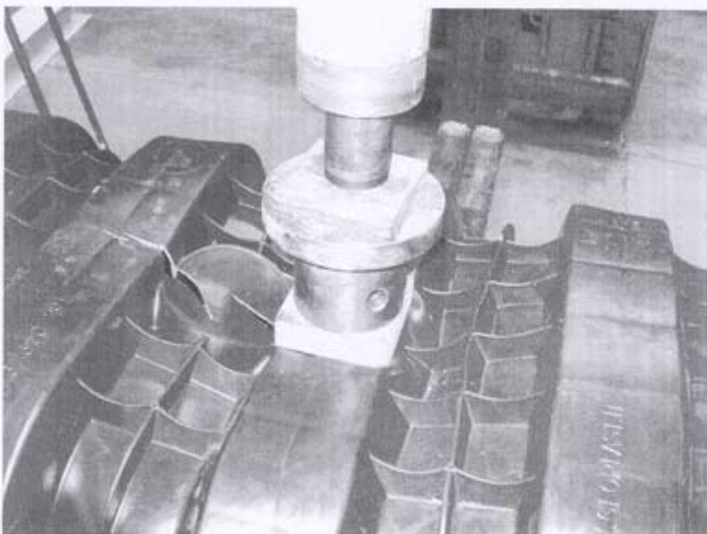
Particolare dell'impronta di carico di punzonamento