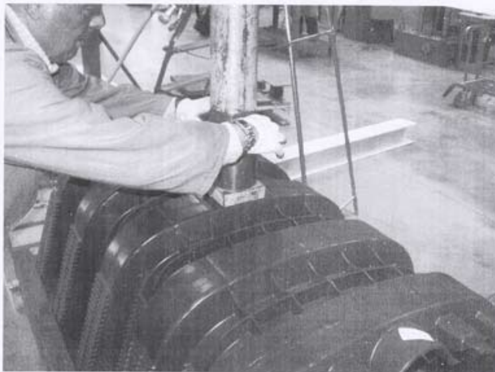
Sistemazione dell'impronta di carico di punzonamento