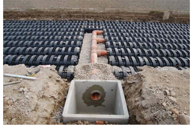
Şek.3 Menhol detayı

Bu projenin geçirimsiz yüzeylerinde (bina ve yükleme alanı) toplanan tüm sel suyu, yükleme alanının altında inşa edilen drenaj havzasında toplanır. Drening'in iki hasır çelikle takviye edilmiş betonarme bir plak ile desteklenen yüksek basınç dayanımı, malların depolanmasına ve ağır yük kamyonlarının geçişine olanak tanır.