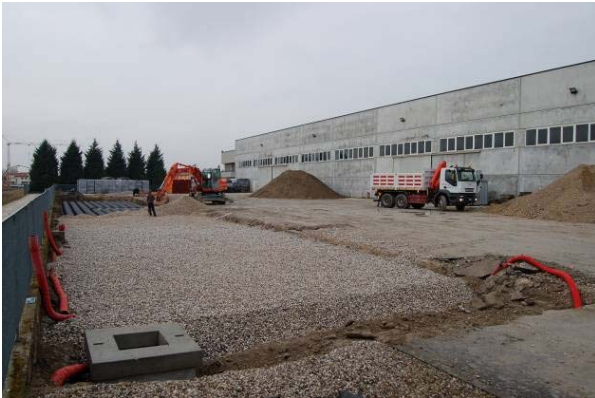
Şek.4 Geri dolgu

Bu projenin geçirimsiz yüzeylerinde (bina ve yükleme alanı) toplanan tüm sel suyu, yükleme alanının altında inşa edilen drenaj havzasında toplanır. Drening'in iki hasır çelikle takviye edilmiş betonarme bir plak ile desteklenen yüksek basınç dayanımı, malların depolanmasına ve ağır yük kamyonlarının geçişine olanak tanır.