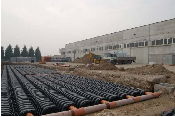
Şek.2 Su giriş detayı