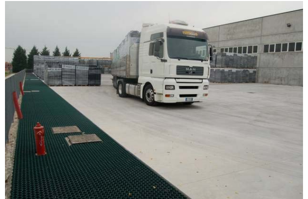
Şek.5 Betonarme plaklı bitmiş yükleme alanı