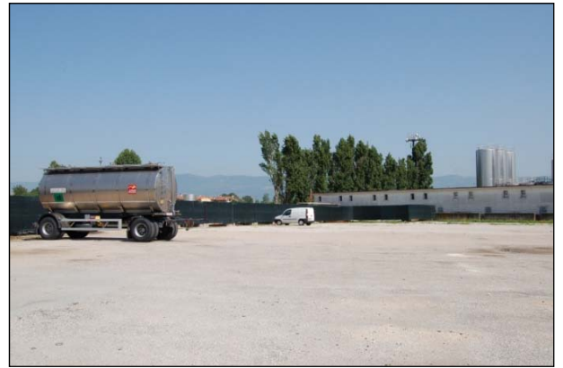
Şek.5 Mandıra otoparkının görünümü