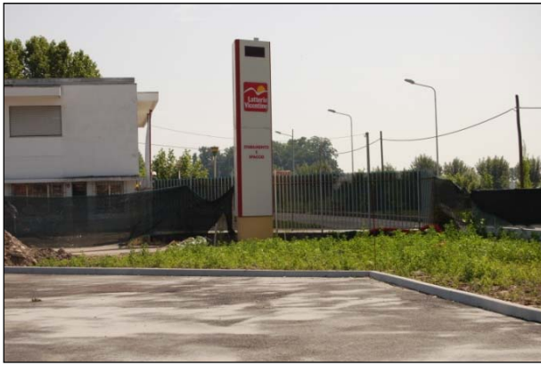
Şek.4 Otopark ve yeşil alan

“Consorzio di Bonifica Pedemontana Brenta” yerel su idaresi, ilgili su geçirmez alandaki sel suyunun mevcut su yönetim sistemine boşaltılmasını engellemiş ve sürdürülebilir bir drenaj sisteminin oluşturulmasını gerekli kılmıştır.