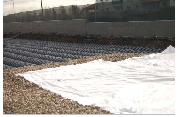
Şek.3 Geotekstil serilmesi

“Consorzio di Bonifica Pedemontana Brenta” yerel su idaresi, ilgili su geçirmez alandaki sel suyunun mevcut su yönetim sistemine boşaltılmasını engellemiş ve sürdürülebilir bir drenaj sisteminin oluşturulmasını gerekli kılmıştır.