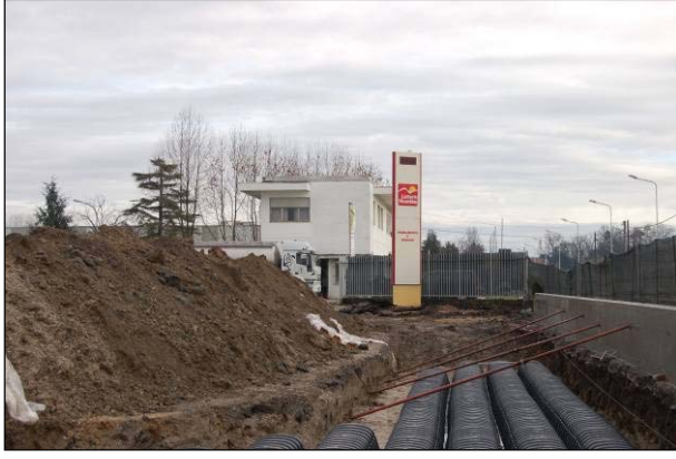
Şek.2 Drening modüllerinin kurulumu